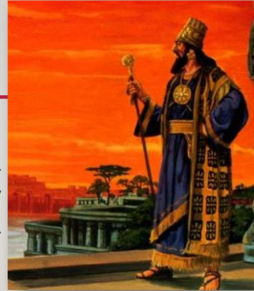
Nabucodonosor, rey de Babilonia.