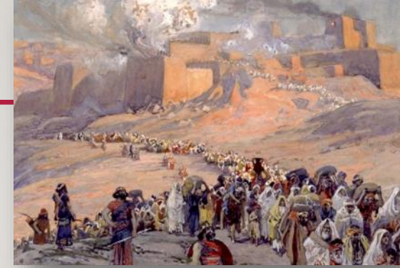
Destrucción del templo de Salomón y exilio.