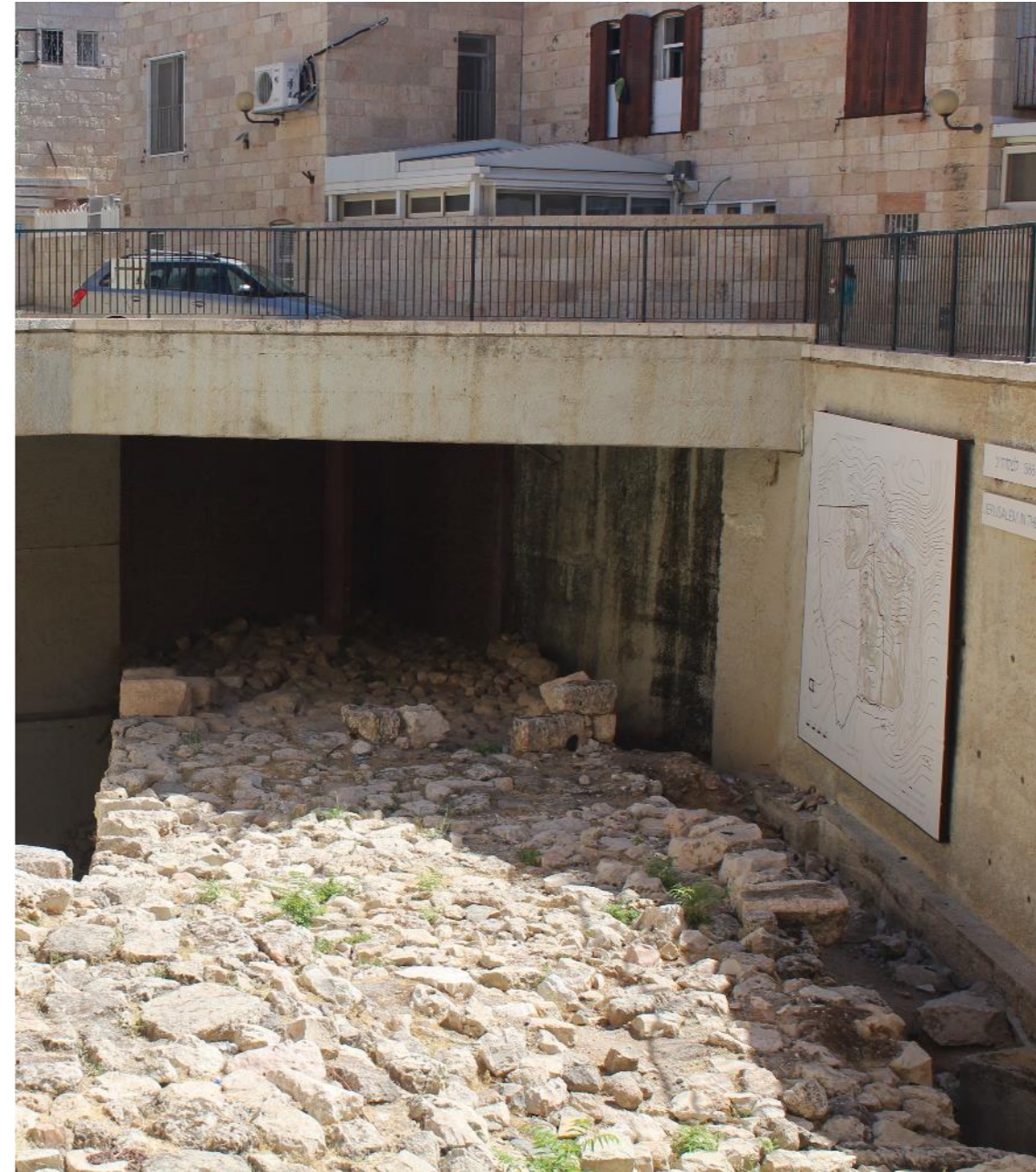
fotografía de restos de la muralla construida en tiempos de Esdras

Esdras se enfrenta a los matrimonios mixtos y ora a Dios confesando el pecado del pueblo.