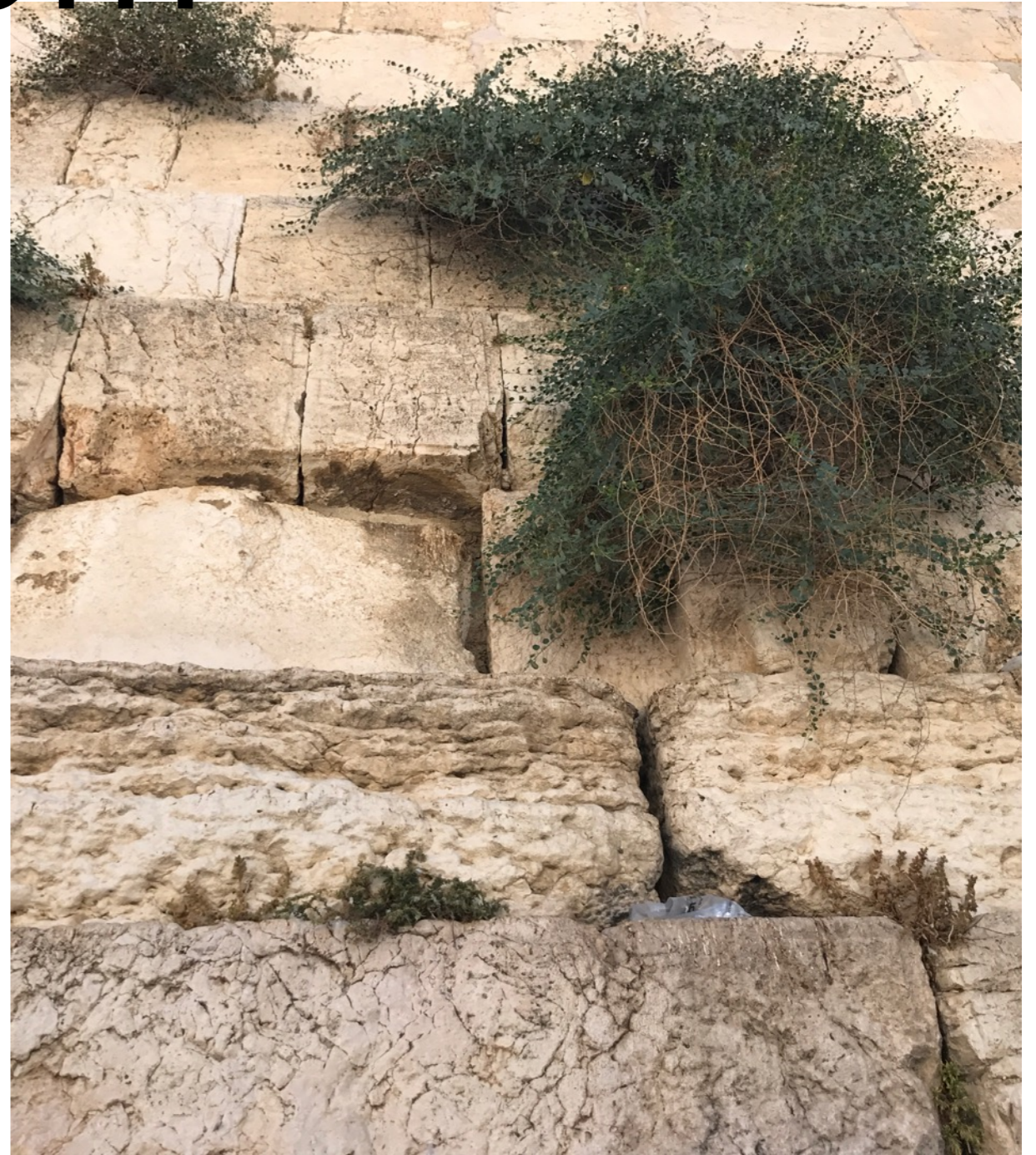
Foto del muro de los lamentos